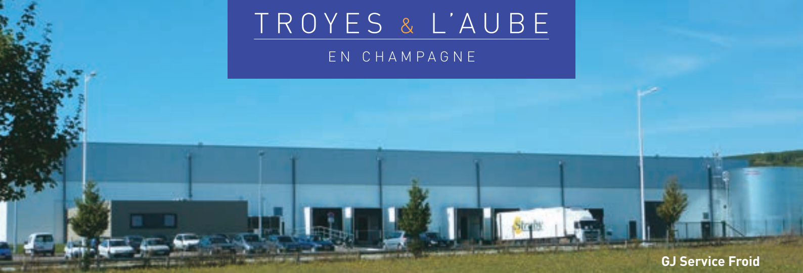
GJ Service Froid